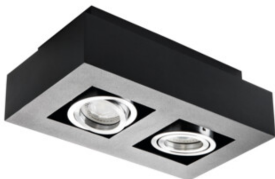
STOBI DLP 250-B